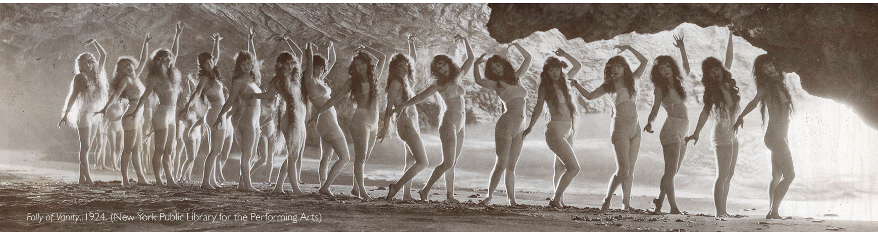
Folly of Vanity , 1924. (New York Public Library for the Performing Arts)