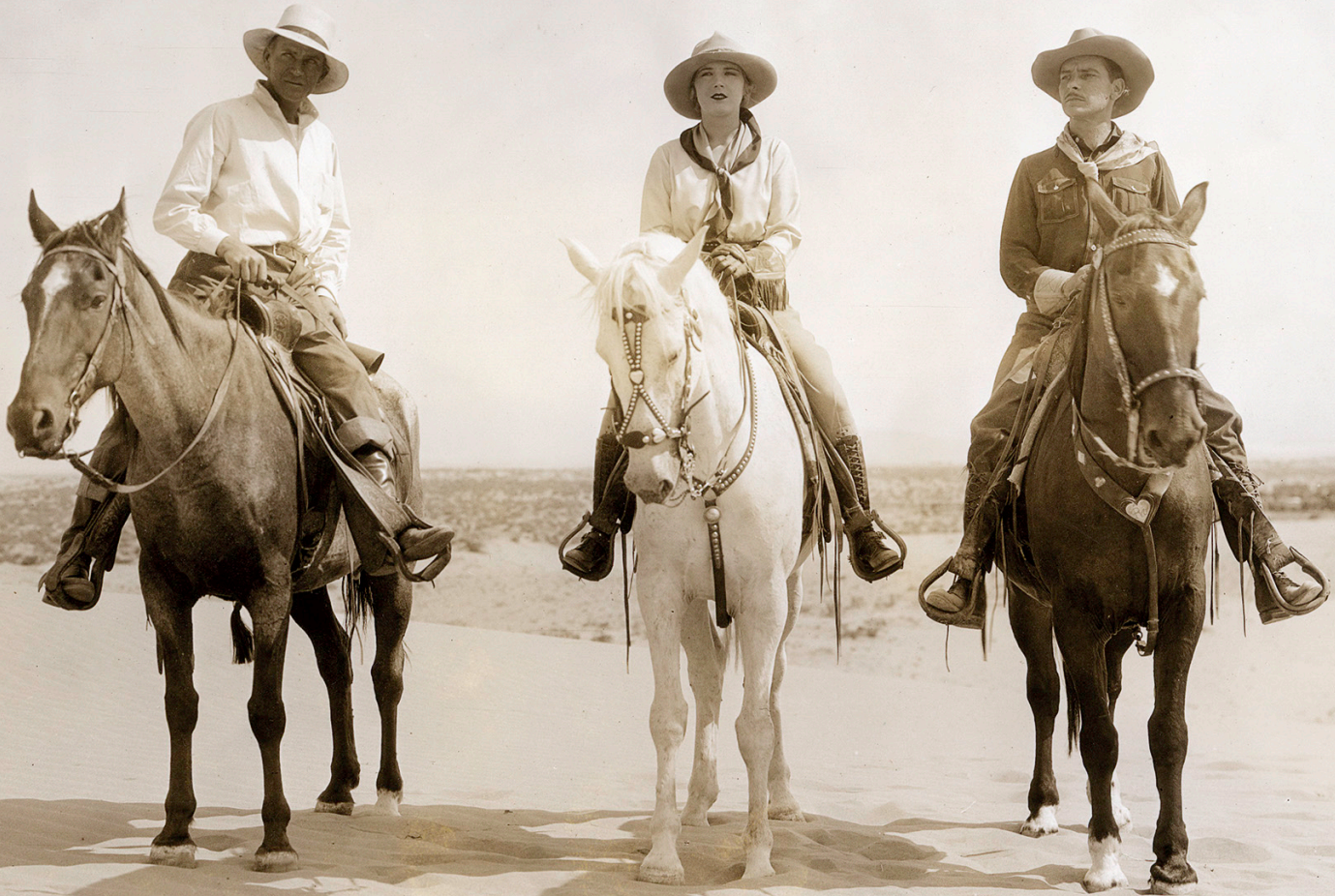
The Winning of Barbara Worth, 1926. Henry King, Vilma Bánky, Ronald Colman.