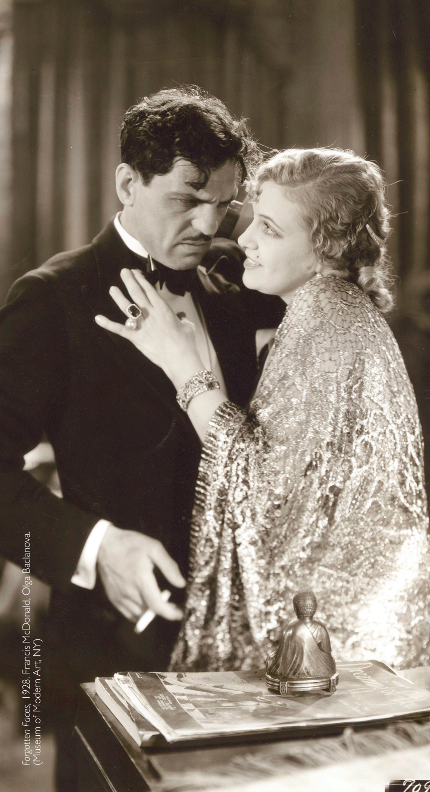
Forgotten Faces, 1928. Francis McDonald, Olga Baclanova.