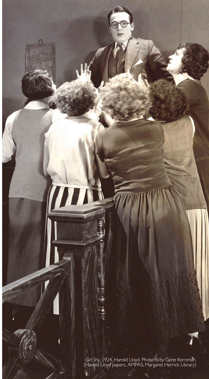
Girl Shy, 1924. Harold Lloyd.

Una selezione di film della 43a edizione del festival è disponibile online. Informazioni e abbonamenti al programma online sono disponibili nella sezione dedicata sul sito delle Giornate.