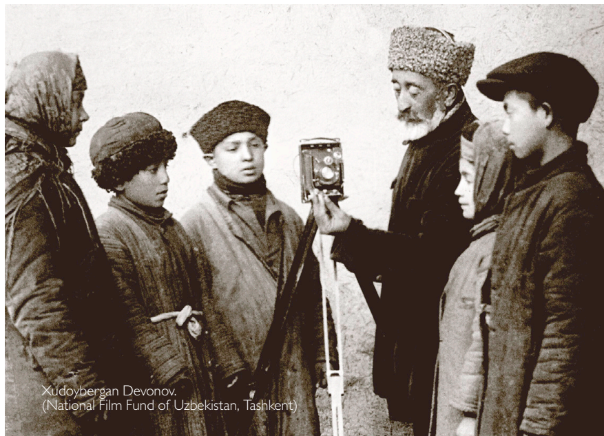
Xudoybergan Devonov.