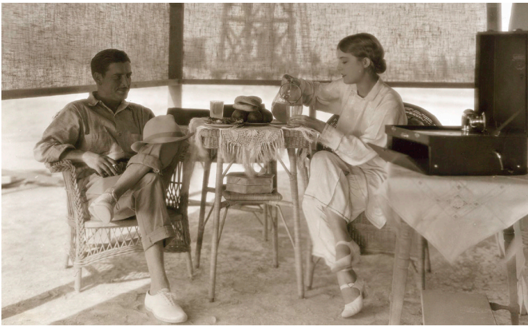
The Winning of Barbara Worth, 1926. Ronald Colman, Vilma Bánky. (MoMA, NY)